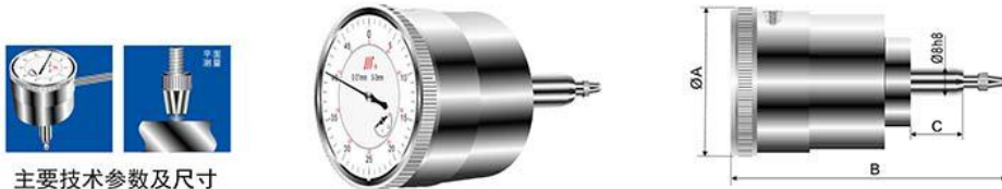
主要技术参数及尺寸