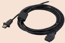
带有调零端子的双头连接电缆