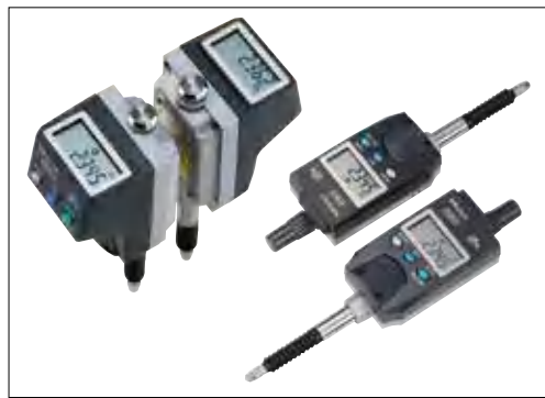
液晶读数反转功能