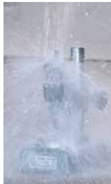
达到 IP66 尘 / 水防护等级，同时也提高了防油能力