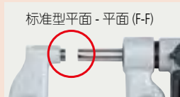
标准型平面 - 平面 (F-F)