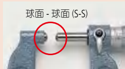
球面 - 球面 (S-S)